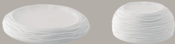
21141244 Taça M Bowl M Bol M △ 365 gr A 34 mm Ø 168 mm © 90 mm △ 4/5 lbs H 1 1/3" Ø 6 3/5" © 3 1/2" €86,40