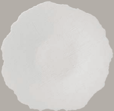
21141247 Prato Fundo Deep Plate Prato Hondo Assiette Creuse △ 540 gr A 69 mm Ø 270 mm CAP. 1130 ml △ 1 1/5 lbs H 2 5/7" Ø 10 5/8" CAP. 38 1/5 oz € 81