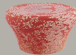
49002521 Prato Degustação L Tasting Plate Glass L Plato Degustación Vidrio L Assiette De Dégustation Verre L △ 1.370 gr A 80 mm Ø 240 mm △ 3 lbs H 3 1/7" Ø 9 4/9" €252