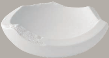
21141241 Taça Bowl Bol △ 640 gr A 69 mm Ø 192 mm △ 1 2/5 lbs H 2 5/7" Ø 7 5/8" €63

Dans les meilleurs plats, la rigueur fait loi. Dans le choix précis des ingrédients et dans leur combinaison méticuleuse, dans le temps de confection et, bien sûr, dans la présentation finale. Pour que tous les détails soient mis en valeur avec précision.