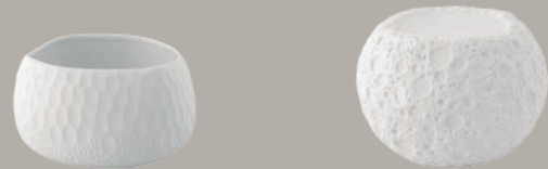
21141261 Taça M Bowl M Bol M △ 275 gr A 65 mm Ø 131 mm CAP. 700 ml △ 3/5 lbs H 2 5/6" Ø 6 1/6" CAP. 23 2/3 oz €176,40